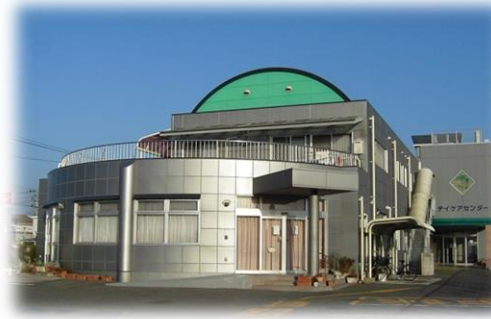
三宅内科小児科医院正面