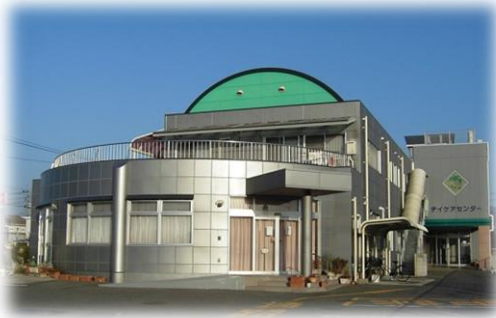
三宅内科小児科医院正面