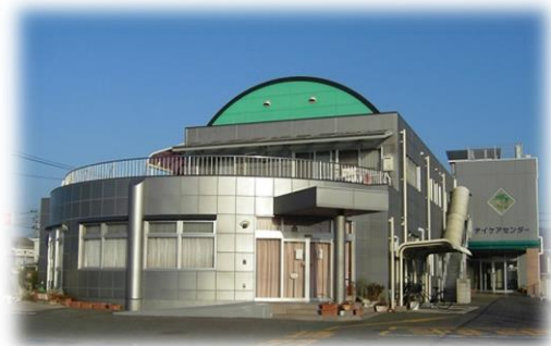
三宅内科小児科医院正面